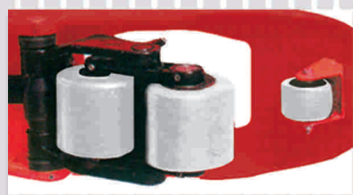
Graseras lubricadoras en todos los rodamientos y articulaciones