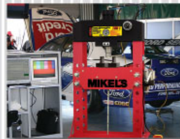
DISEÑADA ESPECIALMENTE PARA TRABAJOS PROFESIONALES