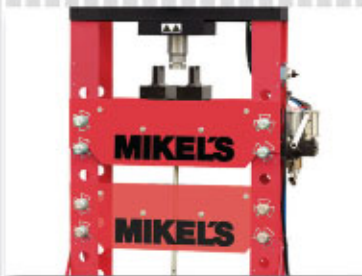
CON SISTEMA DE AJUSTE DE ALTURA DE PLACA DE TRABAJO