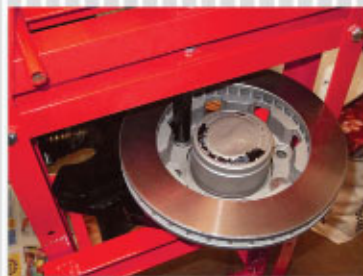
FÁCIL EXTRACCIÓN DE BIRLOS