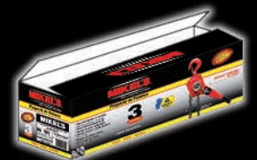
CAJA A COLOR 51 cm x 19 cm x 19 cm