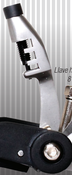
Llave hexagonal 8 mm