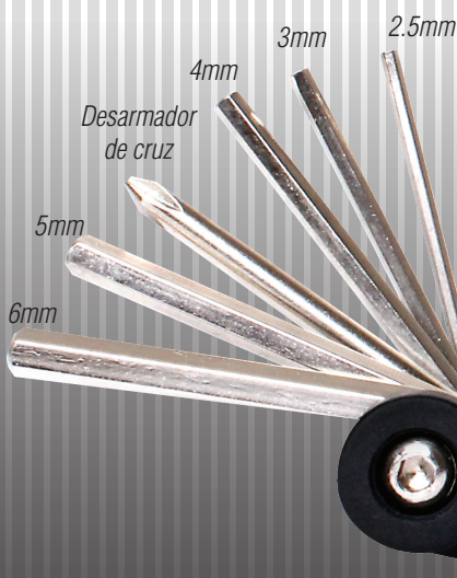
Desarmador de cruz