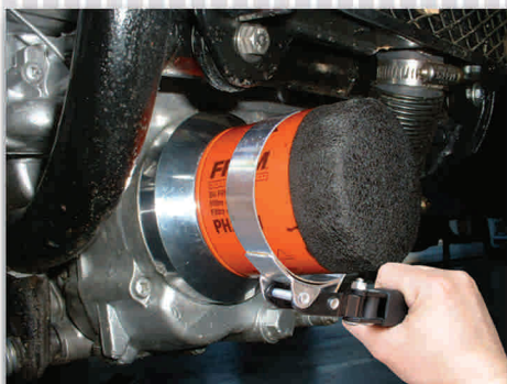
Diseño que permite una buena sujeción del filtro sin dañarlo