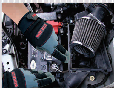
Óptimo agarre de herramienta