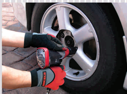
Optimo agarre de herramienta