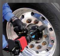
Para uso con herramienta neumática.